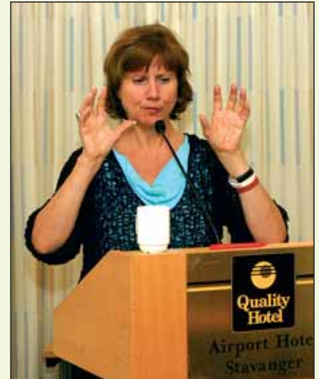
LO leder med klar tale om den politiske situasjonen på Fylkeskonferansen i Rogaland.