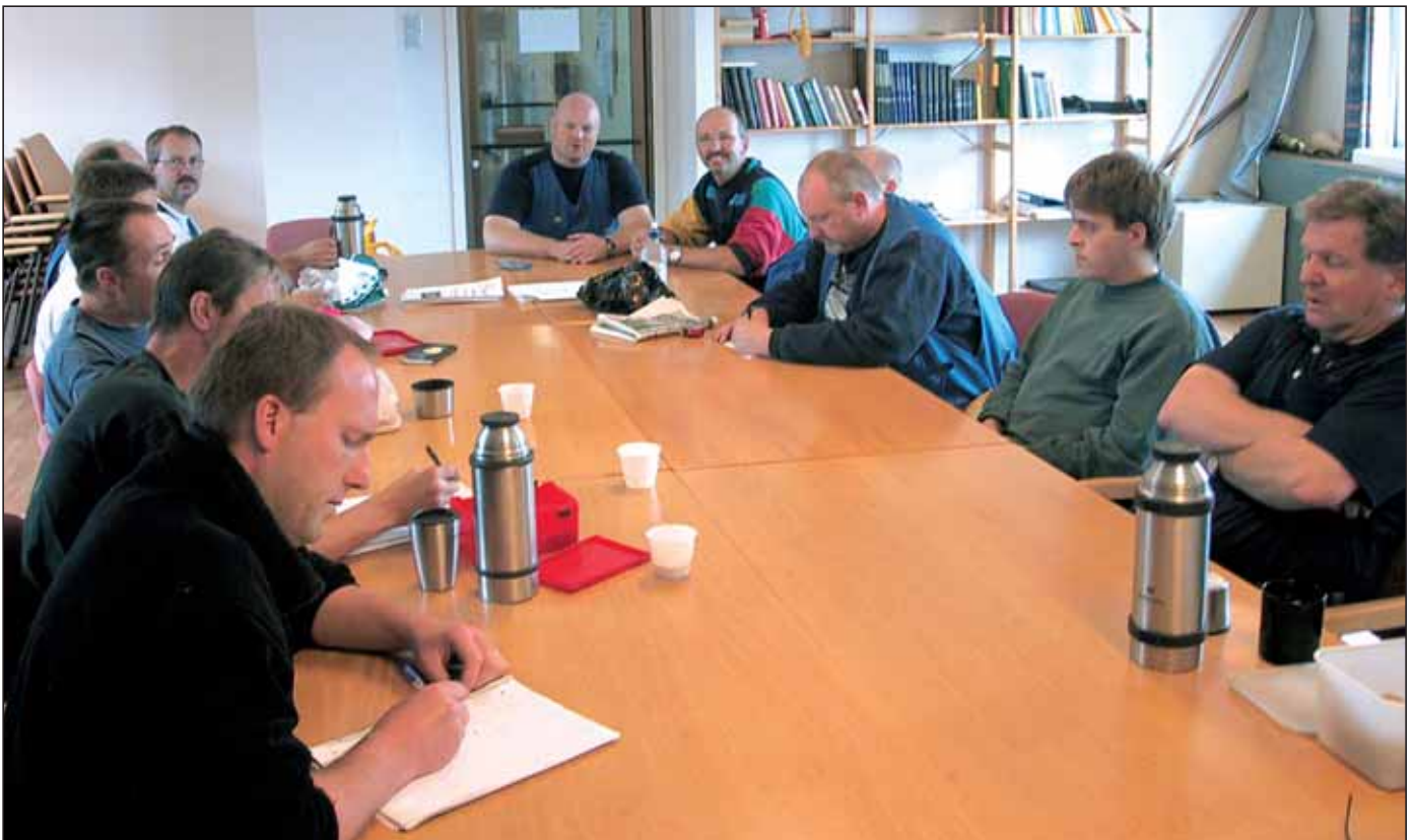
Arkivbilde fra møte hos heismontørene.

Men dette fungerer og kanskje er det andre som kan vurdere om dette passer i sin klubb, fagforening og distrikt.