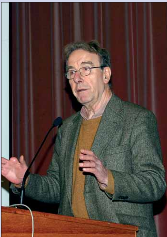
Tidligere AP-leder Reulf Steen.