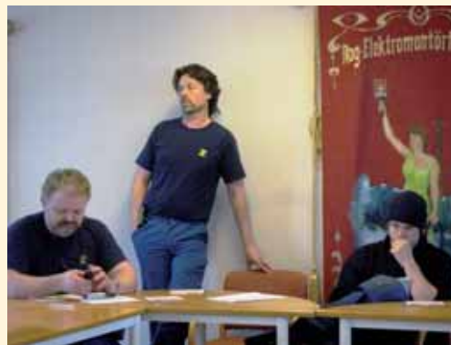
Fra Rønning Elektro klubb sitt årsmøte 2009.