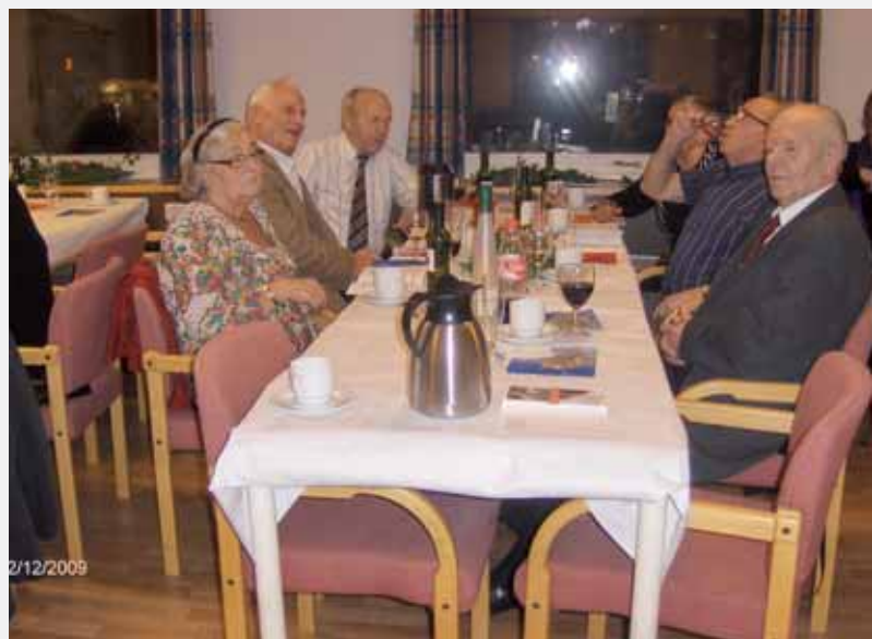
Godt fremmøte og god stemning på seniorklubbens julemøte den 12. desember 2009.