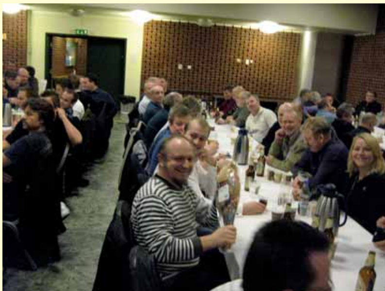
Medlemmer på julemøte i Stavanger.