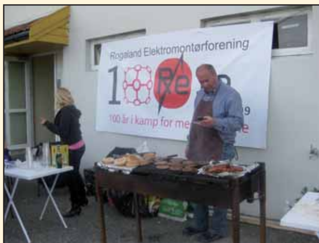
Fra grillparty 2009 som fikk mange gode tilbakemeldinger fra deltakerne.

Distriktet spanderer 2 enheter pr medlem, men sørger for skjenkeløyve hos politiet slik at det kan kjøpes drikke til innkjøpspris videre utover kvelden.