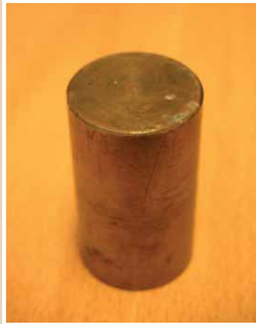
Denne massive messing sikringen ble brukt som erstatning når 63 A, stadig slo ut.

Med revisjon av dagens forskrift frykter fagforeningen at det blir gjort endringer for å kunne sette ufaglærte i arbeid med det som til i dag har vært elektrofagarbeid. Det har vært diskusjoner som mange tillitsvalgte hevder er en svekkelse av forskriften og som kan sette sikkerheten til montør og bruker i fare. Rogaland Elektromontørforening har derfor stort fokus på FKE saken og har diskutert forholdene på både representantskapsmøter og på egne medlemsmøter.