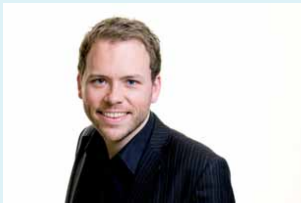
Audun Bjørlo Lysbakken (f1977) er nestleder i Sosialistisk Venstreparti, og fra Bergen. Ved valget 2009 ble Audun innvalgt på Stortinget for SV i Hordaland, og siden oktober samme år har vært Barne-, likestillings- og inkluderingsminister i den rødgrønne regjeringen.