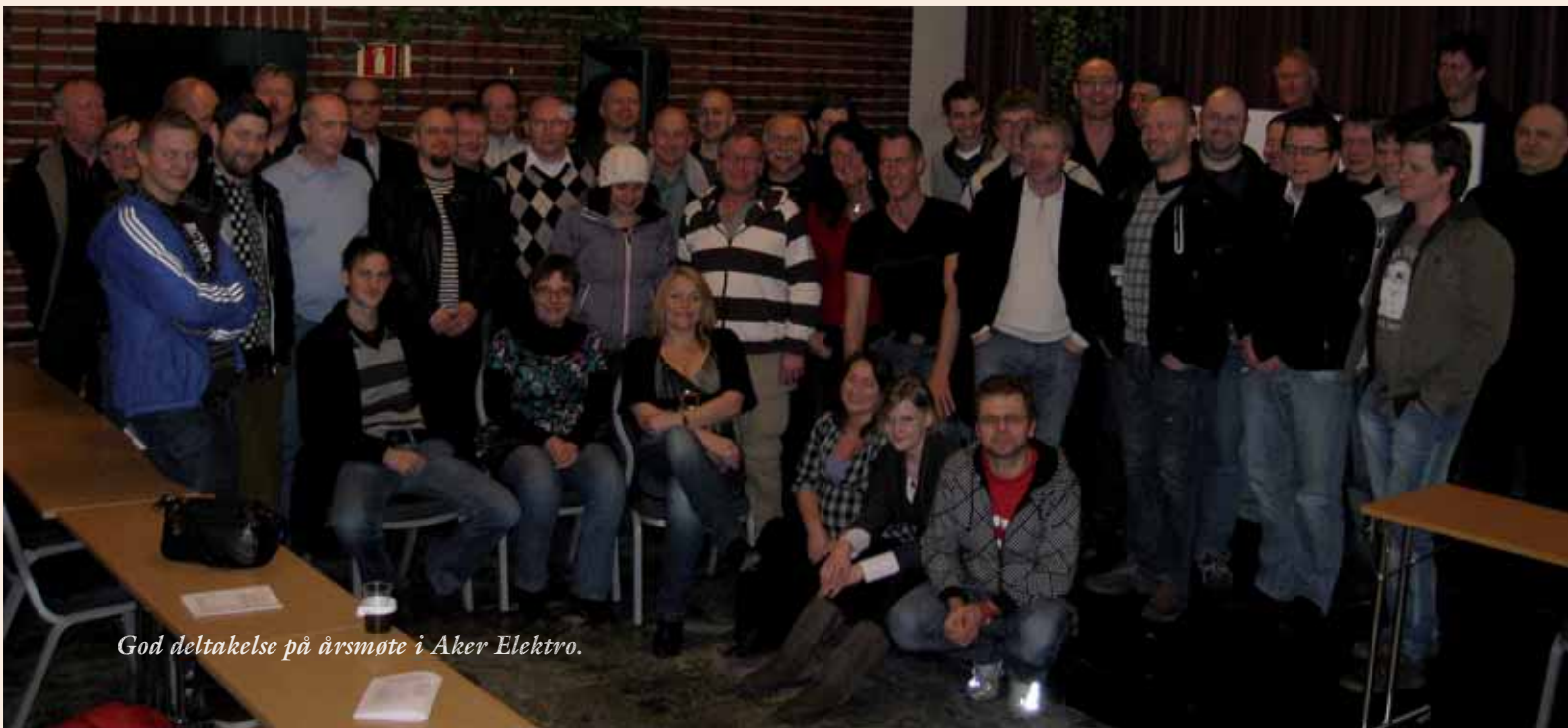
God deltakelse på årsmøte i Aker Elektro.

Etter medlemsmøtet uten både vann og brød, bar det i vei ned til Dolly Dimples for hyggelig samvær med mat og drikke. Det virket som om de fleste koste seg sammen, og mange fikk snakket med gode arbeidskollegaer som de gjerne bare treffer på en eller to ganger i året. (Julemøtet i fagforeningen og årsmøtet i EL&IT klubben) Det hele ble avsluttet med en samling på Cardinal, før det enkelte medlem gikk hver til sitt.