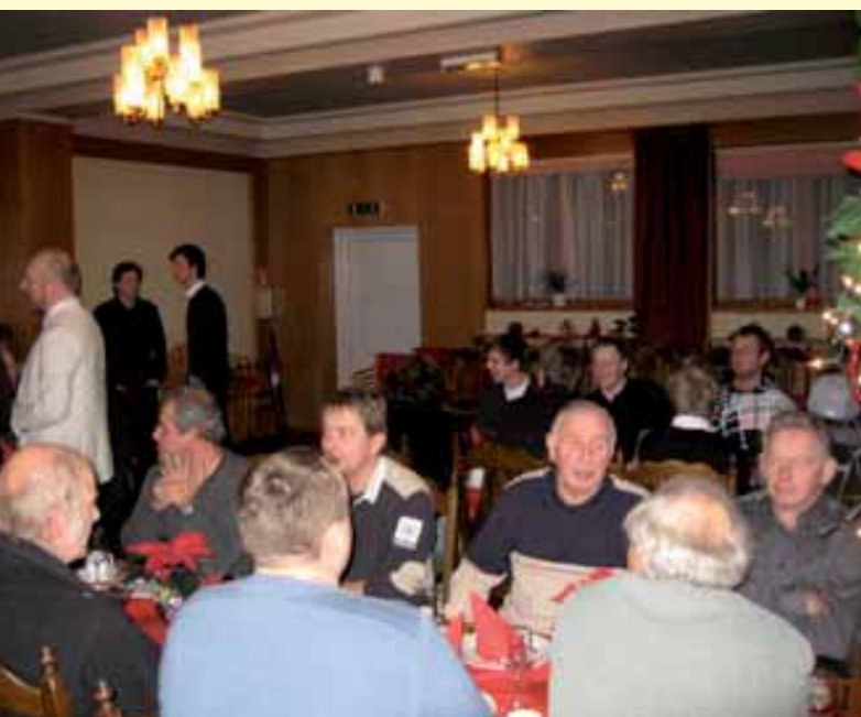
Medlemmer på julemøte i Haugesund