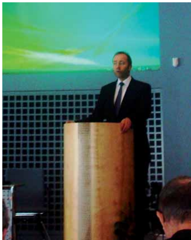
En god og opplagt Trond Giske på talerstolen under LO sin konsernkonferanse.

Han sa også at det hadde vært 6 næringsministere som hadde blitt byttet ut på de siste 5 åra så han hå-