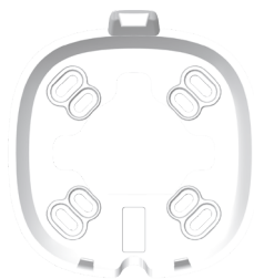
2. DE MONTAGEPLAAT