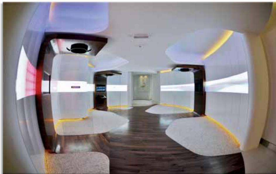
A sala de audiovisual recebeu iluminação indireta e decorativa.

centro da maquete. “Escolhemos estas fontes de luz por causa do pé-direito alto, com nove metros de altura, e a distância horizontal entre elas e o centro da maquete ser grande, o que aumenta a importância da potência. Importamos todas as lâmpadas da Inglaterra exclusivamente para este projeto”, contou o lighting designer.