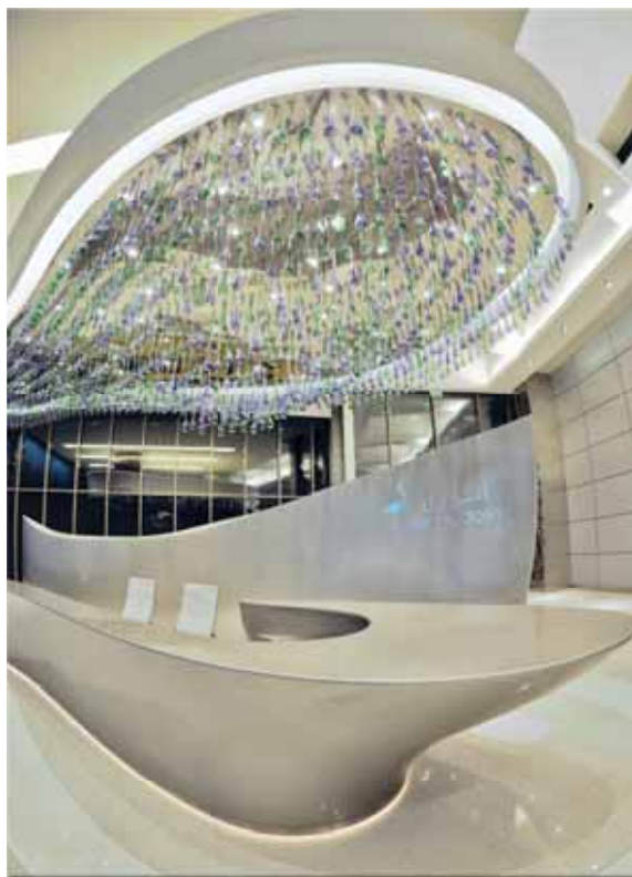
Pendente com lâmpadas MR-16 e cristais ilumina a mesa da recepção.

A miniatura do projeto é iluminada por dez projetores com lâmpadas de vapor metálico de 70W, a 3000K, 9º de abertura e distribuição simétrica, instalados no pavimento superior de vendas e focados, em sua grande maioria, no