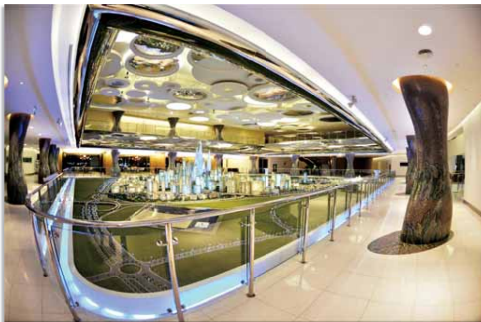
A iluminação da maquete foi o grande destaque do projeto luminotécnico realizado pelo escritório Delta Lighting Solutions.