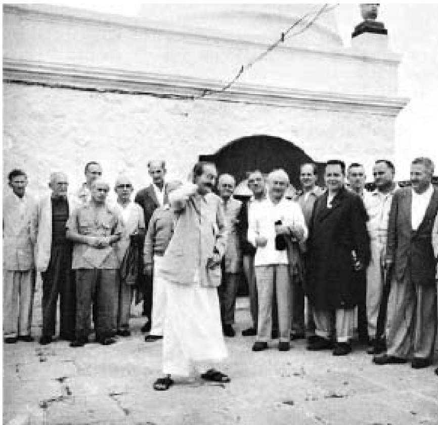
Fuera de la Tumba, en la colina de Meherabad, Meher Baba con los occidentales que asistieron a estas tres semanas increíbles.