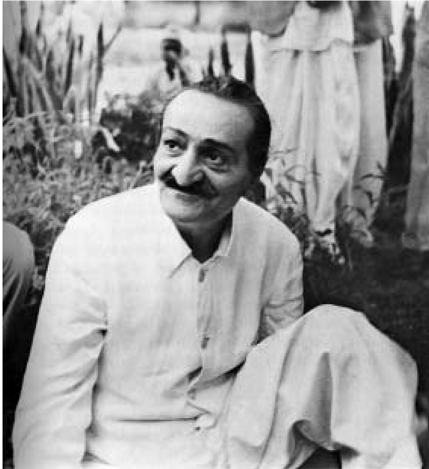
Avatar Meher Baba