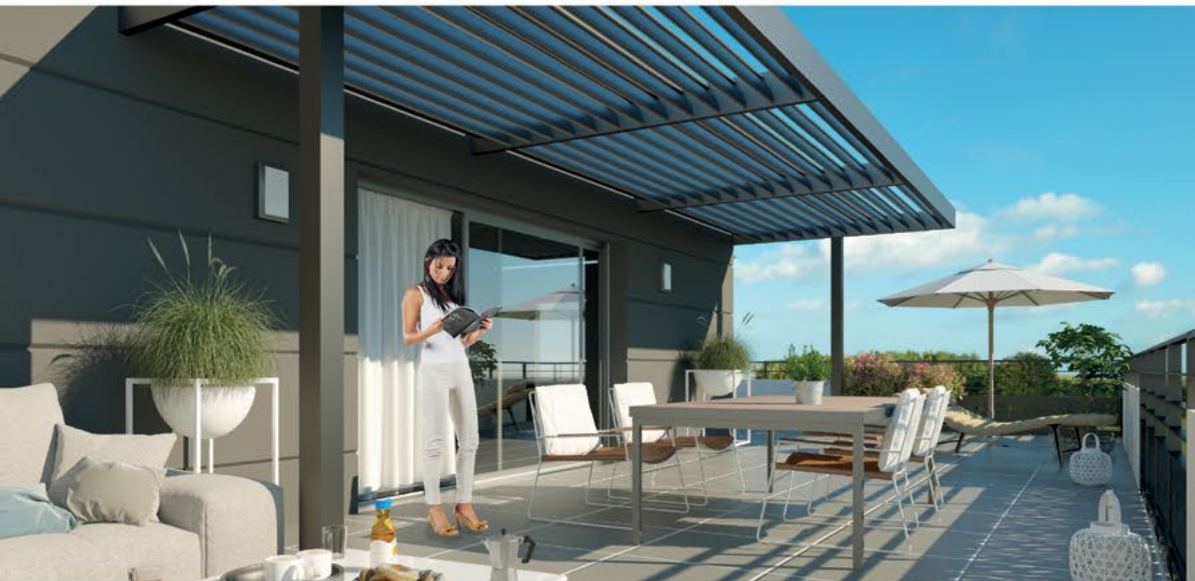
KUTCH Studio - Illustration à caractère d'ambiance - Non contractuelle