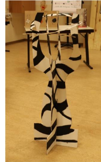
Tag des Gymnasiums 2013