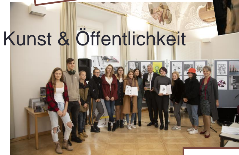
Kunst & Öffentlichkeit