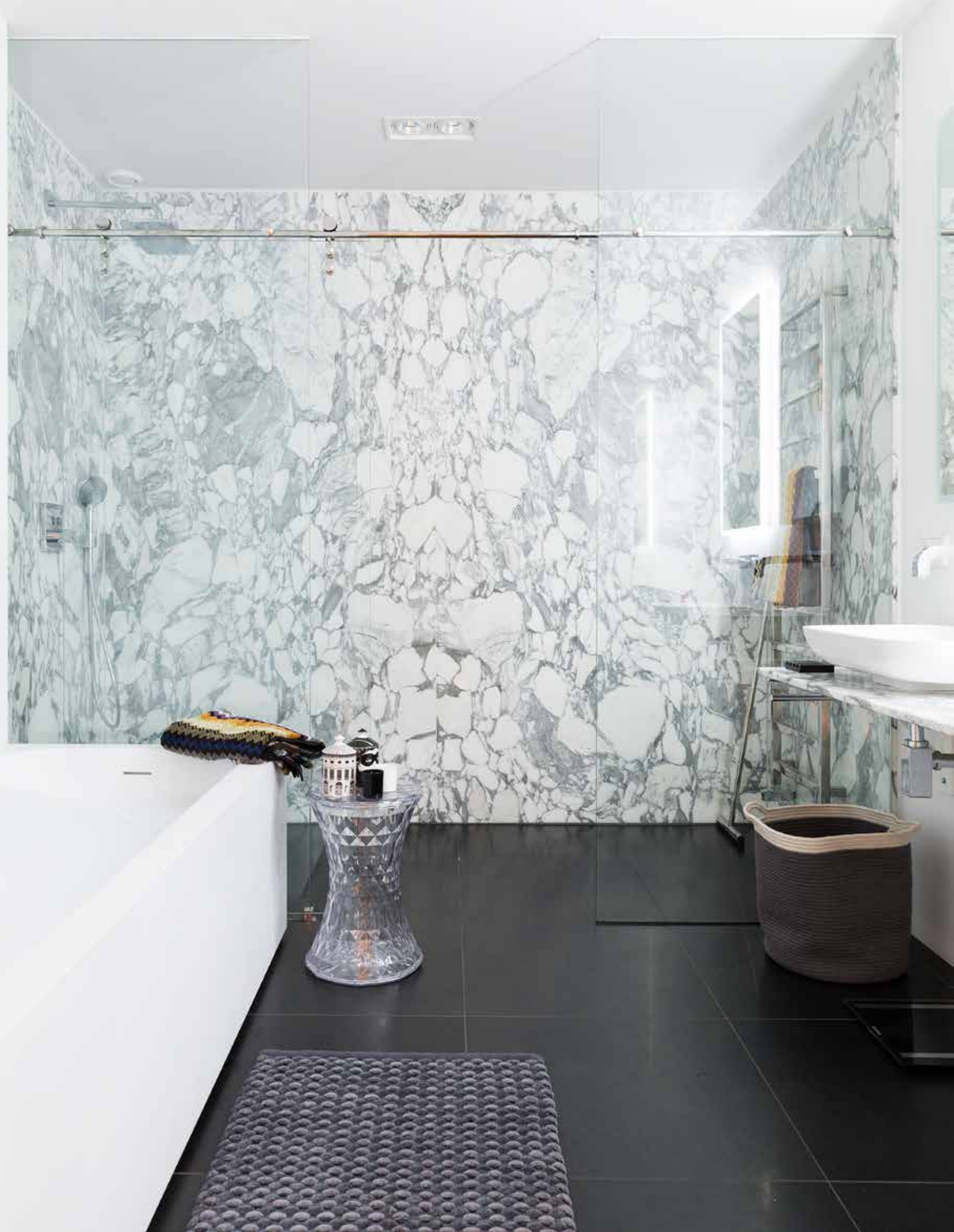
In de badkamer heeft hij het geweld van het arabescato marmer in juiste proportie teruggebracht door een balans te zoeken in simpel en sober sanitair.