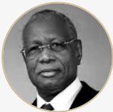
S.E. PROFESSEUR ABDOULAYE BATHILY Ancien Ministre d'Etat, Sénégal et UN RSSG

En plus d'un cohorte d'experts internationaux, notre conseil consultatif réunit des personnalités émérites qui nous suivent bénévolement dans la croissance de nos activités.