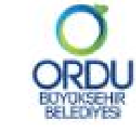
Ordu Büyükşehir Belediyesi