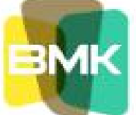
BMK Hukuk Bürosu