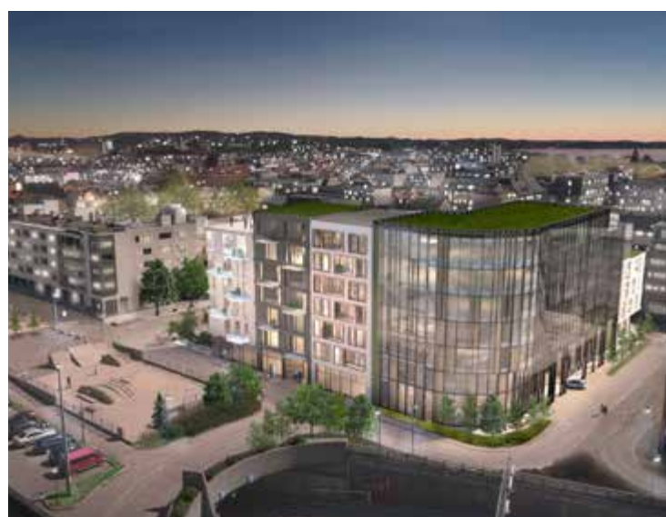
Baneheia Park blir liggende like ved SlottsQuartalet og porten til Baneheitunnelen.