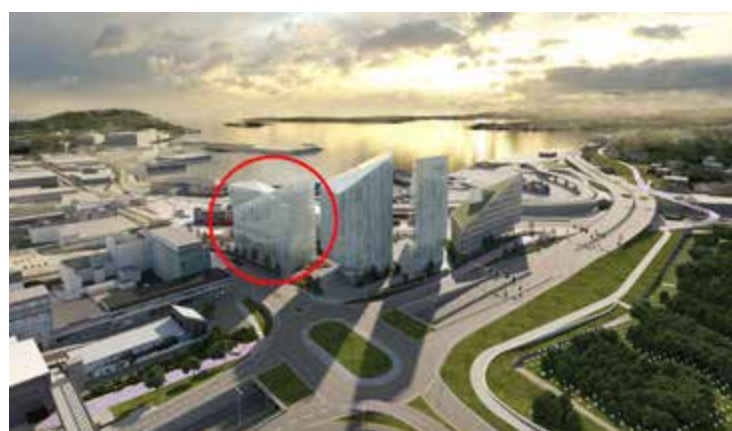
Bygningene tiltenkt politiet innringet. Til høyre ses kontorbygget som har planlagt oppstart til høsten.