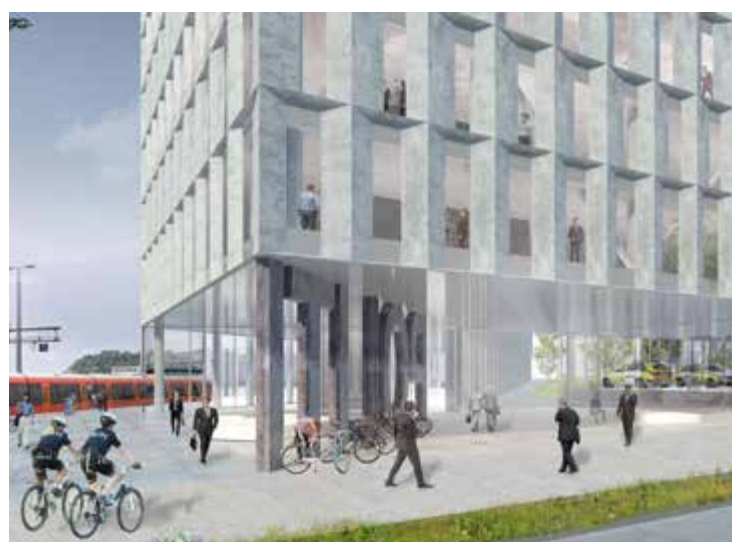
Et nytt politihus illustrert fra Vestre Strandgate, med skinnegangen til venstre. FOTO: GHILARDI/HELSTEN ARKITEKTER