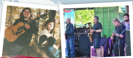
Fire 'N' Ice

The Rendez-vous des artistes allows visitors to see the artwork of more than a hundred painters and sculptors, all in one place.