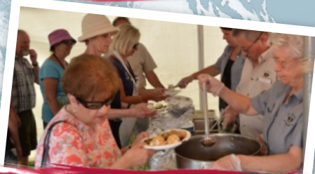
Souper Vendredi & Samedi (public)