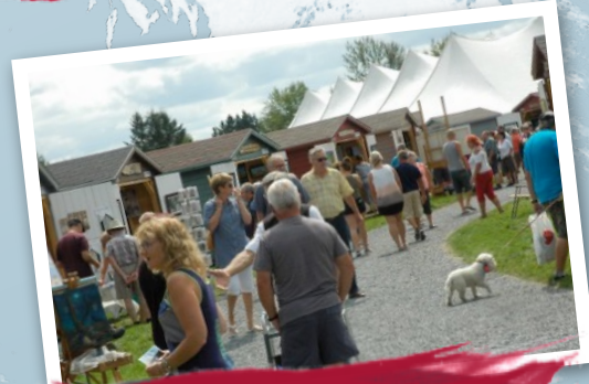
Jerry T Band