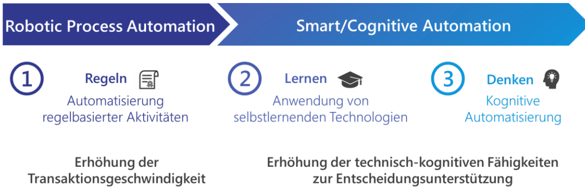
Abbildung 1: Während bei RPA die Transaktionsgeschwindigkeit gesteigert wird, können Smart und Cognitive Automation bei Entscheidungen direkt unterstützen; in Anlehnung an KPMG 2017

Ein weiterer Vorteil der intelligenten Automatisierung: Arbeits- und Ablaufprozesse werden genauestens dokumentiert. Die Vorgänge sind transparent und jederzeit detailliert überprüfbar und nachvollziehbar. Besonders für Prozesse die hohen und vielfältigen Compliance-Vorschriften unterliegen, bildet RPA einen enormen Mehrwert, denn Compliance-relevante Prozesse lassen sich bei gleichzeitiger Entlastung der Mitarbeiter besser überwachen. Zudem verbessert sich durch den Einsatz von Robotic-Tools in der Regel auch die Datenqualität eines Unternehmens, was wiederum die Grundlage für den zunehmenden Einsatz von künstlicher Intelligenz bildet.