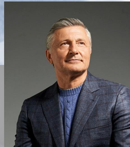
Станіслав Боклан в ролі Петра

2017 — The Line 2016 — Servant of the Nation 2015 — Unbreakable 2013 — The Guide